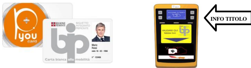
Facsimile Carta BIP e PYou Card - sito internet bip.piemonte.it

Titolo" e avvicinando successivamente la smartcard BIP/PYOU o il chip on paper nella parte inferiore dell'apparato, all'apparire della scritta "Avvicinare la tessera", come indicato nell'immagine seguente: